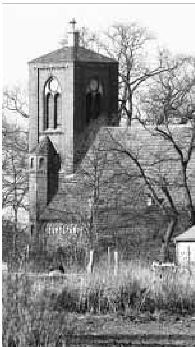
Die Rohrlacker kämpfen weiter für ihre Kirche.

Die meisten Pluspunkte habe Rohrlack mit seinen Wohnheimen für Behinderte gemacht, verriet Vize-Landrat Klaus-Peter Appel. Das Wohnheim bietet 25 Menschen ein Zuhause. Zudem entstanden in der Gärtnerei 16 Arbeitsplätze, sechs weitere in der Holzwerkstatt und zwei in der Bäckerei. Angetan sei die Jury aber ebenfalls von den wirtschaftlichen Impulsen gewesen, die vom Gutshof, vom Gestüt Lindenhof mit seiner Pension sowie der Pferdezucht